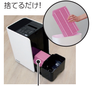
カンタン取替え フィルター