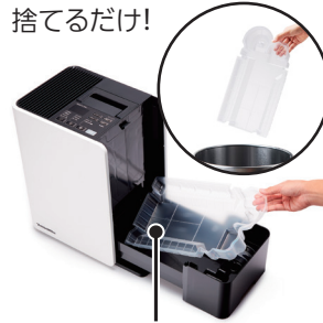
カンタン取替え トレイカバー