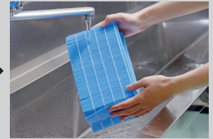
水道水でしっかりすすぎ 洗い(目安2分以上)