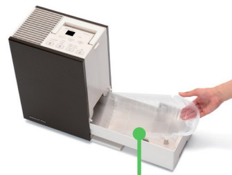
カンタン取替えトレイカバー