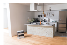
FW-3721SGX(左) HD-LX1221(左下) EF-1200F(右下)