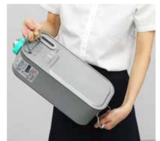
&lt;Wとってのついた5Lタンク&gt;