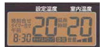
&lt;大型オレンジ液晶&gt;