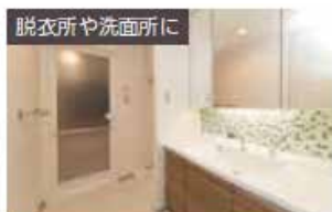
脱衣所や洗面所に