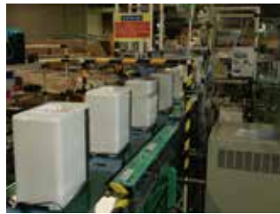
<中之口工場生産ライン>