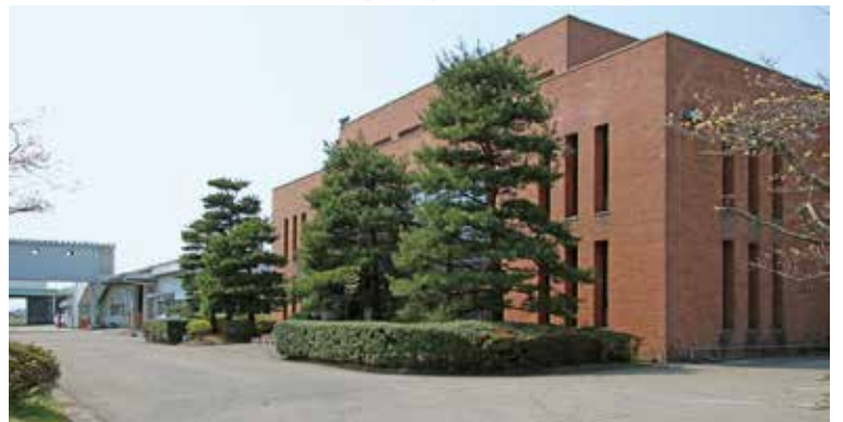
●現在の配送センター管理棟(手前)第二倉庫(奥)